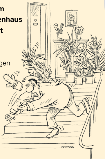
Illustration: Servicebüro zusammen>wohnen</GBV Steiermark

Um die Sicherheit aller im Haus lebenden Personen zu gewährleisten, müssen die Fluchtwege freigehalten werden. Zudem dürfen feuergefährliche Gegenstände nicht im Haus aufbewahrt werden.