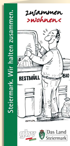
Illustration: Servicebüro zusammen>wohnen</GBV Steiermark

Die Ablagerung von Sperrmüll ist grundsätzlich verboten. Dieser kann jedoch bei der Firma Saubermacher, 8605 Kapfenberg/Pötschach, Mürztaler-Saubermacher-Str. 1 abgeliefert werden. Unkostenbeitrag ist EUR 3,00 pro Fuhre. Öffnungszeiten: MO - FR von 8.00 bis 16.00 Uhr Tel. 05 9800 3500.