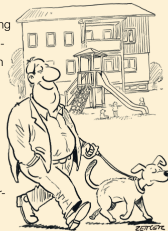
Illustration: Servicebüro zusammen>wohnen</GBV Steiermark

Aus hygienischen Gründen sind Hunde von Kinder- spielplätzen fernzuhalten. Zudem ist das Füttern von Tauben und anderen Vögeln nicht erlaubt.